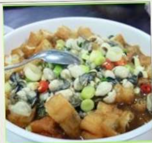
ถนนโบราณสี้อเฟิ่น