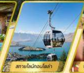
สกายไลน์กอนโดล่า