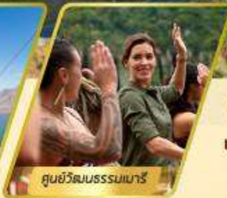
ศูนย์วัฒนธรรมเมารี