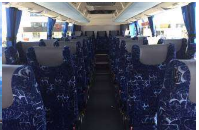
* ลุกค้าจำนวน 15 ท่านขึ้นไป ใช้รถบัสขนาด 30 - 35 ที่นั่ง*