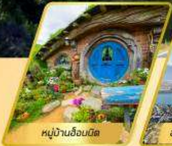
หมู่บ้านฮอบบิต

เที่ยวเกาะเหนือ และเกาะใต้ : 10 วัน 8 คืน