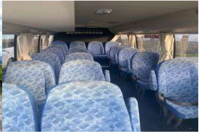
* ลุกค้าจำนวน 10 - 14 ท่าน ใช้รถบัสขนาด 19 - 21 ที่นั่ง*