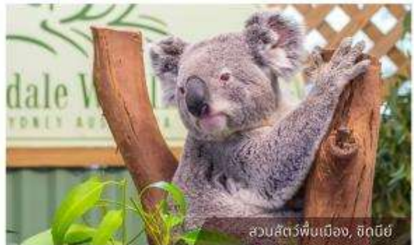
สวนสัตว์พื้นเมือง, ซิดนีย์