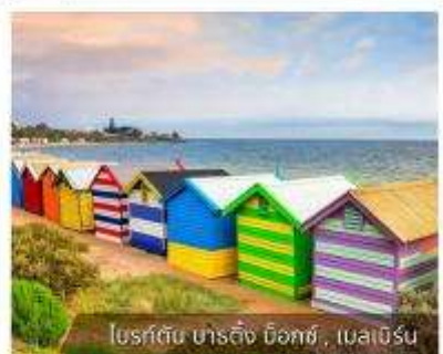
โบสถ์ต้น ชาร์ลิ่ง บ็อกซ์, เมลเบิร์น