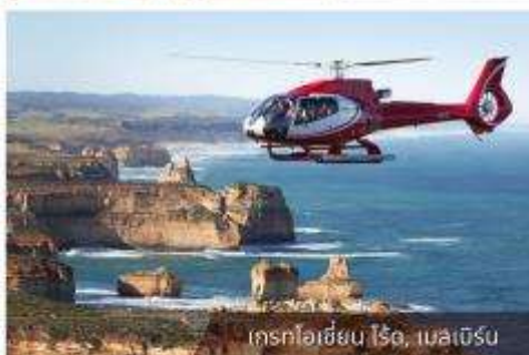
เกรทโอเชียน ไรค์, เมลเบิร์น