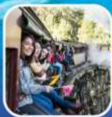
รถไฟจักรไอน้ำโบราณ