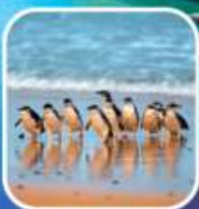
เพนกวินที่เกาะฟิลลิป