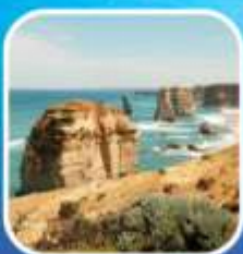
Great Ocean Road (ครึ่งสาย)