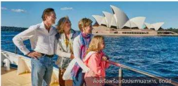
ล่องเรือพร้อมรับประทานอาหาร, ซิดนีย์