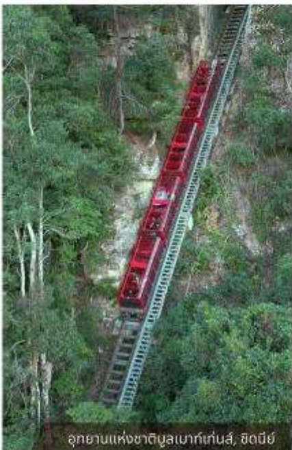
อุทยานแห่งชาติบลูเมาท์เทนส์, ซิดนีย์