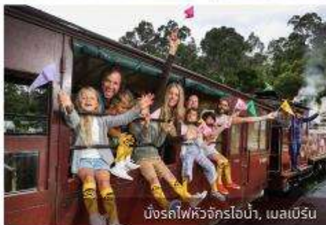
บึงรถไฟจักรไอน้ำ, เมลเบิร์น