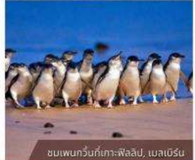
ชมเพนกวินที่เกาะฟิลลิป, เมลเบิร์น