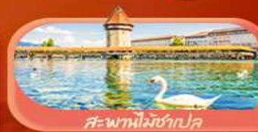
สะพานไม้ซังปก

Highlight เยือนหมู่บ้านแสนสวยเซอร์แมท เช็กอินศาลาไทยสุดงามที่โลซาน เที่ยวลูเซิร์น ชมสะพานไม้ซังและอนุสาวรีย์สิงโต ซาลี แพลทิน ชมประติมากรรม The Fork และปราสาทซิลลองริมทะเลสาบ เยือนมิลาน มหาวิหารดูโอโม เที่ยวเวนิส เมืองลอยน้ำสุดโรแมนติก อินกับรักอมตะที่บ้านจูเลียต และช้อปปิ้งจุใจที่ Serravalle Outlet