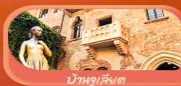
บ้านจูเลียต