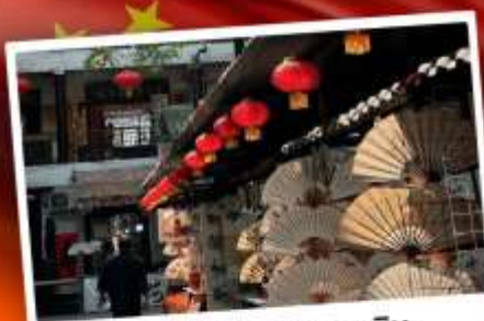
ถนนโบราณซูหยวนเหมิน

"มรดกโลกพันปี สุสานทหารดินเผา" แต่งชุดจีนโบราณ เดินถนนวัฒนธรรมต้าถิง