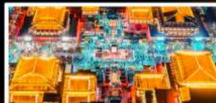
ถนนวัฒนธรรมต้าถิง