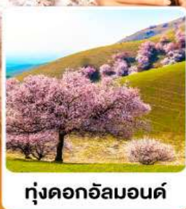
ทุ่งดอกอัลมอนต์