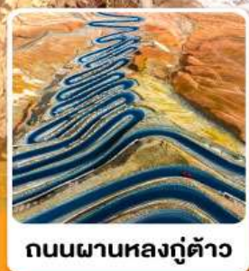
ถนนผานหลงตู้ต้าอว