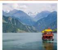
ห้องเรือทะเลสาบเทียนฉือ