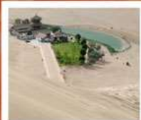
เมืองมิ่งซาชาน