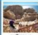
เขตพิศาจทะเล