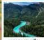
อุทยานคานาสือ