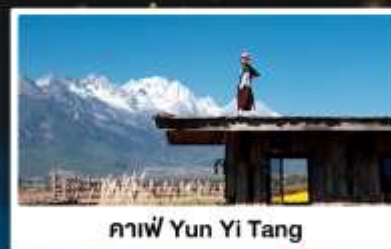
คาเฟ่ Yun Yi Tang