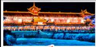
สะพานหนานเฉียว BLUE TEARS

สวนบ้านฮวา - อุทยานหลุมฟ้าสะพานสวรรค์ สีดรุณี - หงหยาดัง - รถไฟฟ้าทะเลลึก สะพานหนานเฉียว BLUE TEARS พักโรงแรมระดับ 4 ดาว - ไม่ลงร้านช้อปปิ้งพิเศษ สุกี้หม่าล่า เปิดปิกนิก