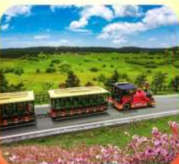
"อุทยานเขานางฟ้า"

บินตรงลงชิง • อุ่หลง หลุมฟ้าสะพานสวรรค์ • ระเบิดยงเกี้ยว • อุทยานเขานางฟ้า หงหยาดัง • นิ่งรถไฟทะลุติ๊ก • ล่องเรือชมฉางชิ่งยามค่ำคืน • ศาลาประชาคม (ด้านนอก) มรดกโลกผาหินแกะสลักต้าจู้ • เมืองโบราณสี่ปาตี้ • วัดหลิวฮั่น • ตึกตะเกียบ