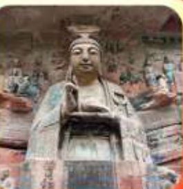
"ผาหินแกะสลักต้าจู้"