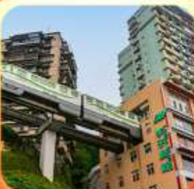
"นึ่งรถไฟทะลุติ๊ก"