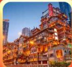
"ล่องเรือชมวิวหงหยาดัง"