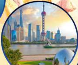
นอร์ทบิ้น กรีนแลนด์