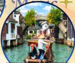
เมืองโบราณจูเจียเจีย