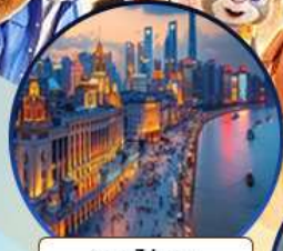
หาดไวทาน