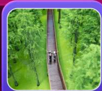
"ป่าสนชิงซาน"