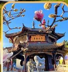
วัดหยวงตง