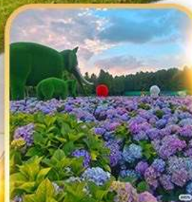
ดอกไม้ตามฤดูทงกา