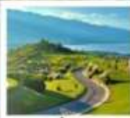
ภูเขาอวี่นเซียงชาน