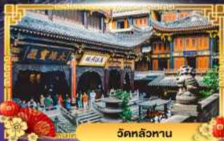
วัดหลัวหนาน