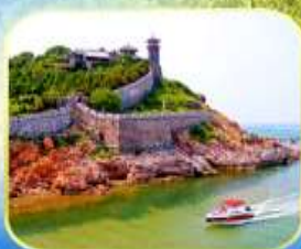
เจดีย์เฝิงโหล