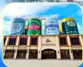
โรงเบียร์ซิงเต่า