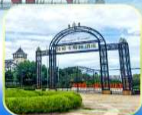
ไร่ไวน์จางยู