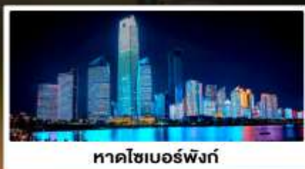
หาดไซเบอร์ฟิงก์