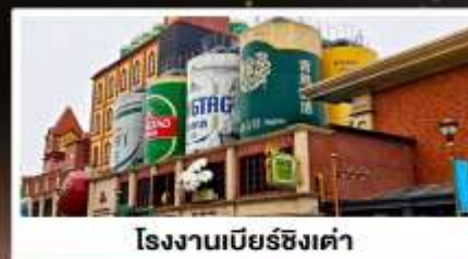
โรงงานเบียร์ชิงเต่า