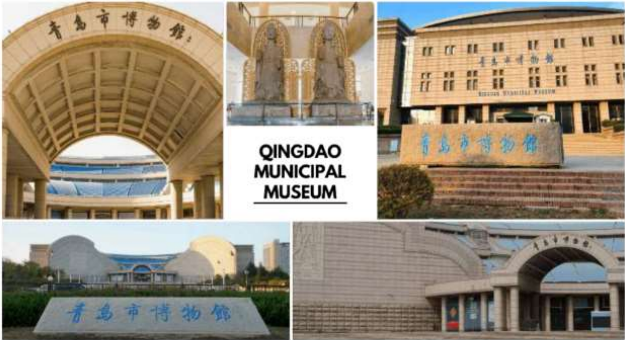
QINGDAO MUNICIPAL MUSEUM