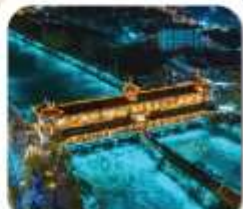
"สะพานหมานเจียว"