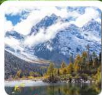
"ปี้เผิงโกว"

ชมความงาม 2 อุทยาน • สี่ฤดูนี้ • หวงเฉียวโกว • ปี้เผิงโกว • พระใหญ่เล่อซาน สะพานหมานเจียว น้ำตาสีฟ้า • ห้องสมุดสุดเก๋ จงซูเก๋ • แพนด้ายักษ์บนจอมเขาสี ชอยกัวงชอยแคม • ถนนคนเดินซุนซีสู๋ • แพนด้ายักษ์บนบึงดึก • ถนนคนเดินจินหลี่