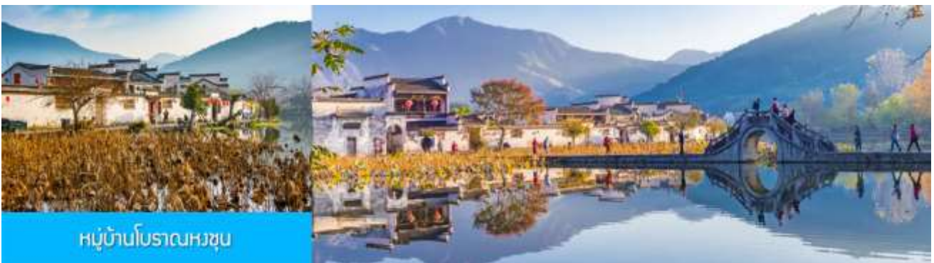
หมู่บ้านโบราณหงซุช

ไกด์ท้องถิ่นนำเสนอโปรแกรมทัวร์เสริมบัตรชมการแสดงชุด ตำนานรักเมืองซ่ง 宋城千古情 การแสดงภายในโรงละครที่ดีที่สุด และได้รับรางวัลมากที่สุดของประเทศจีน.....อัตราค่าบริการสำหรับโปรแกรมเสริม ท่านละ 380 หยวนหรือ 1,900 บาท ใช้เวลาประมาณ 90 นาที ค่าบริการรวม ค่าตัวชมการแสดง ค่ารถบัสรับ และค่าน้ำที่วิวของไกด์ท้องถิ่น