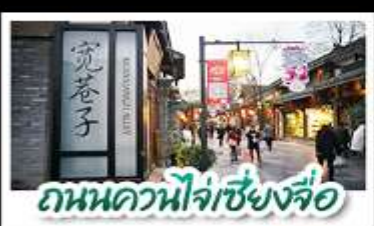
ถนนควนโจ้วเซียงจื่อ