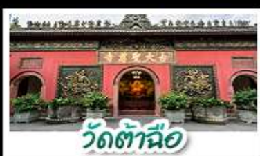
วัดต้าซือ