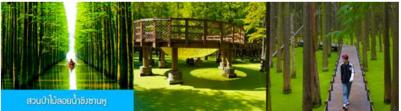
สวนป่าไม้ลอยน้ำชิงซานหู

หลังอาหารเช้าท่านเดินทางโดยรถบัสสู่เมืองหลิงอัน 临安市 (ระยะทาง 175 กม. ใช้เวลาเดินทางราว 2 ชั่วโมงเศษ)