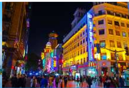
ถนนคนเดินหนานจิงลุ่