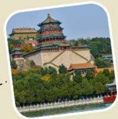
4 พระราชวังฤดูร้อน