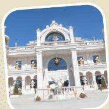
6 POP LAND