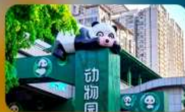
สถานีหมีแพนด้า