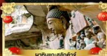
พาคินแกะสลักต้าจู่