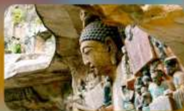
ฆาตินแกะสลักต้าจู้