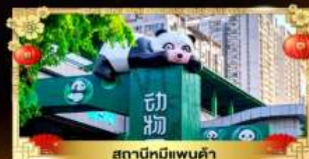
สถานีหมีแพนด้า