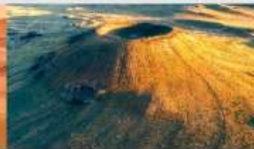
ภูเขาไฟอูลันฮาตา

*ทางบริษัทฯ ขอสงวนสิทธิ์ในการสลับโปรแกรมทัวร์ตามความเหมาะสมขึ้นอยู่กับสถานการณ์หน้างาน โดยคำนึงถึงผลประโยชน์ของลูกค้าเป็นสำคัญ