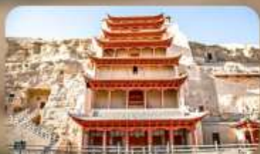
กำม่อเกาคู