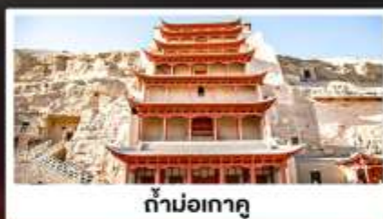
ถ้ำม่อเกาตุ