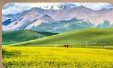
ทุ่งหญ้าซีเหลียน