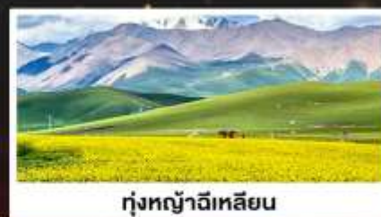
ทุ่งหญ้าฉีเหลียน