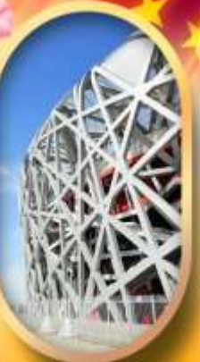
ผ่านชมสนามกีฬาโอลิมปิก