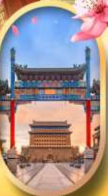
ถนนคนเดินเจียมเหมิน