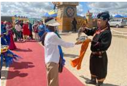
พิธีต้อนรับแขกด้วยเหล้า