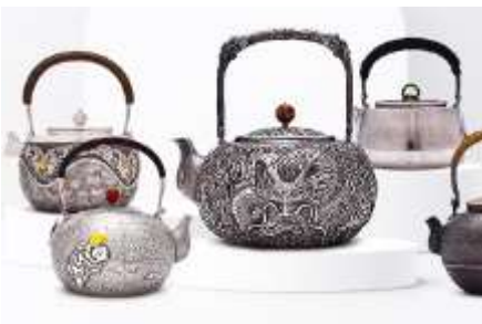
พิพิธภัณฑสถานเครื่องเงินมองโกล