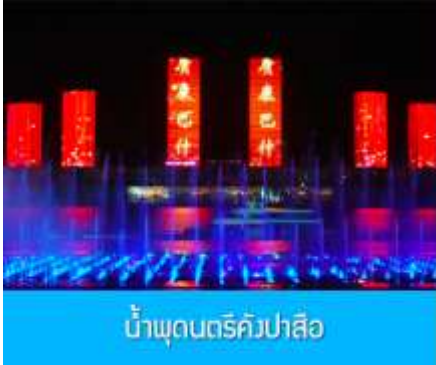
น้ำพุดนตรีคังปาสื่อ

จากนั้นนำท่านเดินทางกลับสู่ เมืองเออร์ดอส 鄂尔多斯 (ระยะทาง 180 กิโลเมตรใช้เวลาประมาณ 3 ชั่วโมง ) รับประทานอาหารค่ำ ณ ภัตตาคาร (9)