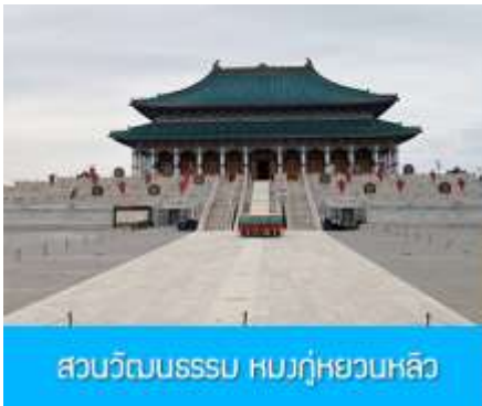
สวนวัฒนธรรมหมงกู่หยวนหลิว

พักที่ ORDOS BOYU AIRUI HOTEL โรงแรมระดับ 4 ดาวท้องถิ่น หรือเทียบเท่าในเมืองเออร์ดอส