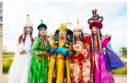
แต่งชุดพื้นเมืองมองโกล