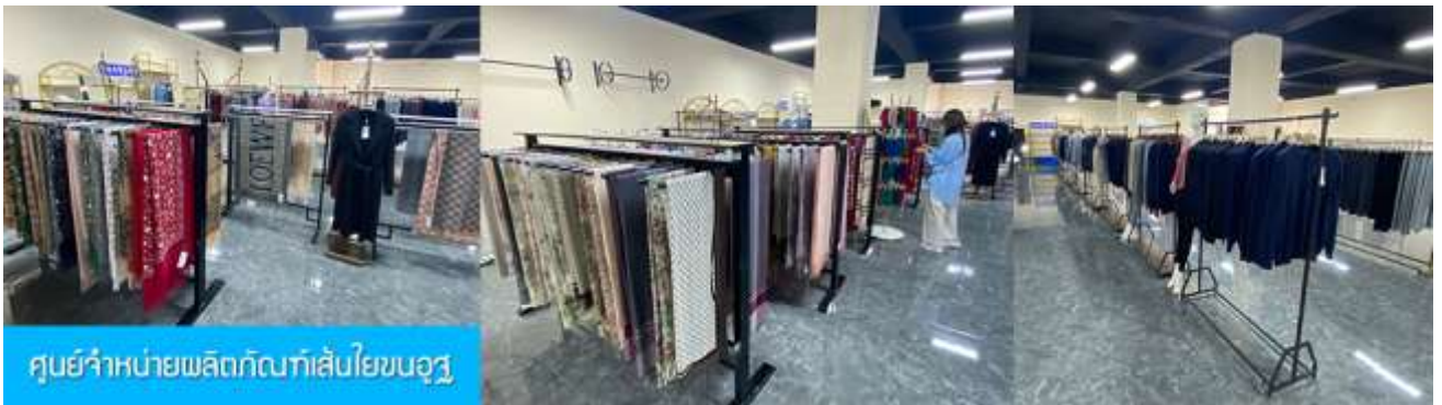
ศูนย์จำหน่ายผลิตภัณฑ์เส้นใยขนอูฐ

พักที่ ORDOS GLASSLAND MONGOLIAN YURT เป็นห้องพักสไตล์มองโกเลีย (ระโจม)