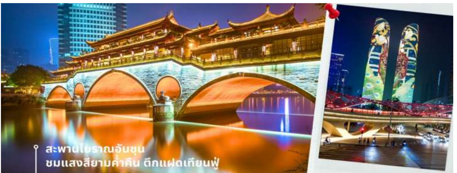
สะพานโบราณอันชุน ชมแสงสียามค่ำคิน ตึกแฝดเทียนฟู

➔ นำท่านเดินทางเข้าที่พัก AC HTL MARRIOTT 4 ดาวหรือเทียบเท่า