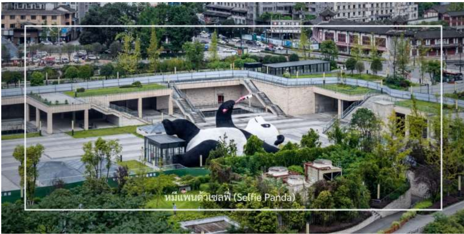
หมีแพนด้าเซลฟี่ (Selfie Panda)

เที่ยวชม ถนนคนเดินความจำย (ชอยกว้าง-แคบ) (Kuanxiangzi Alley) ถนนโบราณหรือในชื่อภาษาไทยจะถูกแปลออกมาว่า "ถนนชอยกว้างชอยแคบ" โดยมีนัยว่า หากถนนมีความกว้างนั้นหมายถึงพื้นที่สำหรับคนชนชั้นสูง หรือคนมีฐานะ เพราะคนสมัยนั้นโดยสารกันด้วยรถม้านั่นเอง แต่หากเป็นชอยแคบๆ ก็จะเป็นที่พักอาศัยของคนที่มีฐานะปานกลาง ก่อนจะมีการบูรณะให้กลายเป็นแหล่งท่องเที่ยว ถนนคนเดินความจำยเป็นสถานที่ที่มีความคึกคักและมีชีวิตชีวา โดยเฉพาะในช่วงเย็น ที่ผู้คนมักออกมาเดินเล่นและสนุกกับกิจกรรมต่างๆ ถนนนี้เต็มไปด้วยร้านค้า ร้านอาหาร และร้านขายของที่ระลึก นักท่องเที่ยวสามารถเลือกซื้อสินค้าท้องถิ่น เช่น งานหัตถกรรม เสื้อผ้า และของฝากต่างๆ รวมถึงอาหารท้องถิ่นที่อร่อย