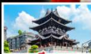
เอาเซียงวาเซา