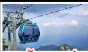
กระเช้าเขาหยงชาน