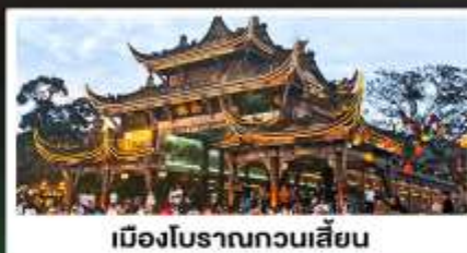
เมืองโบราณทวนเสียน