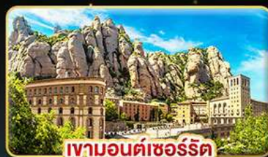
เขามอนต์ซอร์ริต