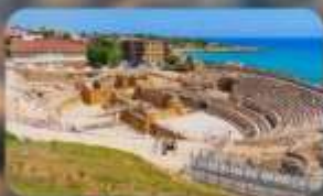
เมืองคาร์ราโกนา