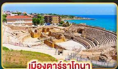
เมืองตารราโกนา