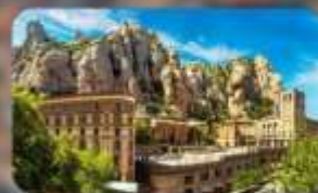
เขามอนต์เซอรัลด์