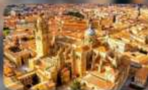
เมืองซาลามังกา