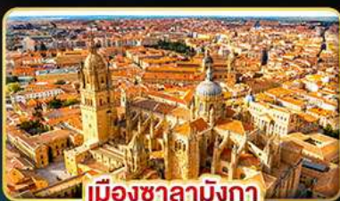
เมืองซาลามังกา