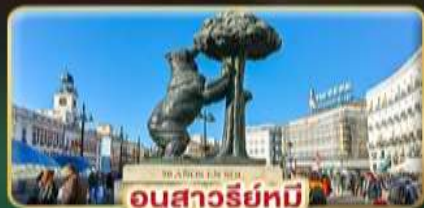
อนุสาวรีย์ทมิ