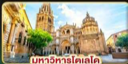
มหาวิหารโคเลโด