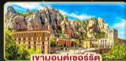
เจามอนต์เซอร์รัต