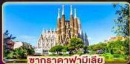
ซากราดาฟามีเลีย