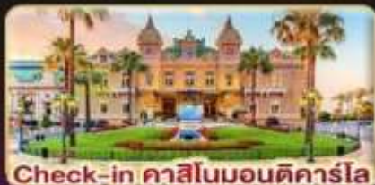
Check-in คาสีโนมอนติคาร์โล