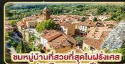
ชมหมู่บ้านที่สวยงามที่สุดในฝรั่งเศส (มูสติเยแซงก์มาร์)