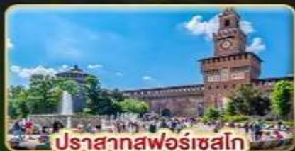
ปราสาทฟอโรเซลโก

📅 เดินทาง : 28 พ.ค. - 06 มิ.ย. | 05-14 ส.ค. 15-24 ต.ค. 69