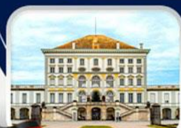
พระราชวังนิมเฟนบวร์ก