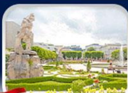
สวนมิราเนียล ซาลซ์บวร์ก