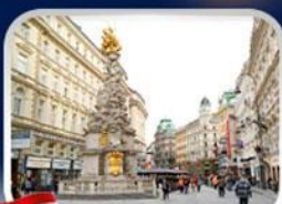
ซ็อมป์บาร์ทเนอร์สตรีก