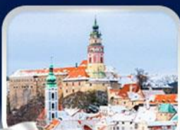
เมืองเฮสกี คุลมอฟ