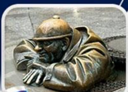
ประติมากรรม Cumil

มาเรียนพลาซซ์ • บ้านเกิดโมสาร์ท • พระราชวังฮอฟบวร์ก • ซาลส์บวร์ก • บ้านเกิดโมสาร์ท • เกรโกเดรสตรีก • ทะเลสาบคอนิกซ์ • หมู่บ้านอัลส์สตัดท์ • อนุสาวรีย์มาเรียเทเรซา