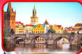
เขื่อนอินสพานชาร์ลส์