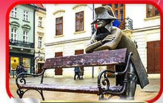
ย่านเมืองเก่าปราทิสลาวา

เที่ยวเมืองสวยริมทะเลสาบ ฮัลล์สตัดท์ • ชมเมืองไข่มุกแห่งโบฮีเมีย เซสกี กรุงลอน • ปราก • เวียนนา • ซอปปิงพาร์นดอร์ฟ เอาก์เล็ท