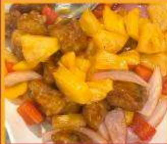
กระดุกหมูผัดเปรี้ยวหวาน