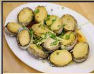
เป๋าฮื้อสดนึ่ง