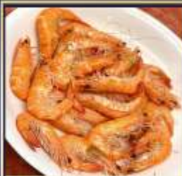
กุ้งหวานลวก