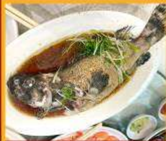
ปลาหนึ่งซีอิ๊ว