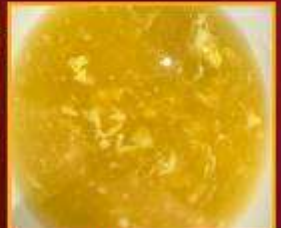
ซุปรข้าวโพด