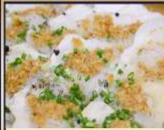
หอยเชลล์อบวุ้นเส้น