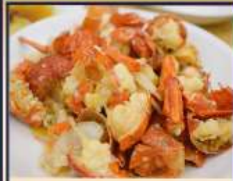
กุ้งมังกรอบซีส