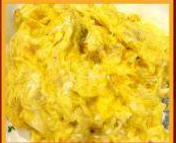
ไข่เจียวทรงเครื่อง