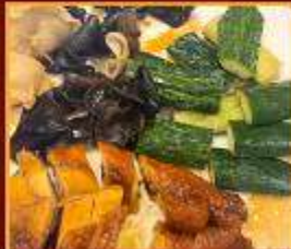
ไก่ แดงกวา เห็ดหูหนู