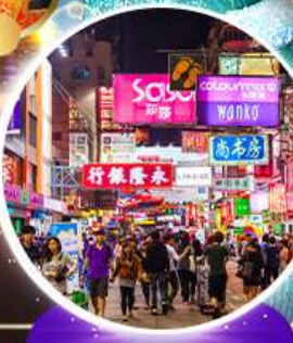
Shopping Taim Sha Tsui