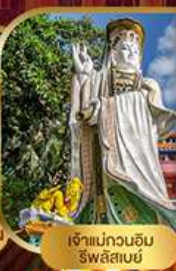
เจ้าแม่กวนอิม ริฟลิสซีย์