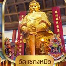
วัดแฉกงหมิว