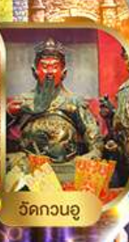
วัดกวนอู