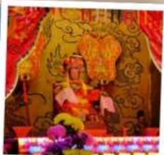
เจ้าแม่ทับทิม จอสเฮาส์เบย์