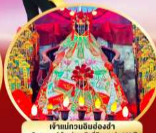
เจ้าแม่กวนอิมย้งฮ่า นมัสการองค์เจ้าแม่กวนอิมที่มีอายุกว่า 600 ปี