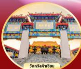
วัดหวังต้าเซียน ขอพรสุขภาพ ความรัก