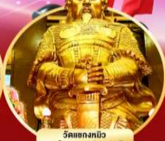
วัดเขกกงมิว ขอพรโชคลาภ การเงิน และสุขภาพ