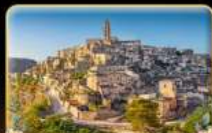
ตามรอย 007 เมือง Matera