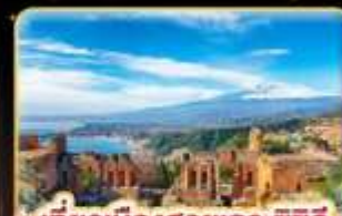
เที่ยวเมืองสวยเกาะซิซิลี Taormina