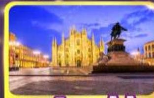
มหาวิหารคูโอโม