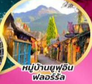
หมู่บ้านยูฟุอิน ฟลอรัล