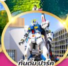
กันดั้มปาร์ค ฟุกุโอกะ