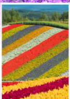
ทุ่งดอกไม้หลากสี