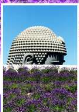
เจดีย์พระพุทธรเจ้า