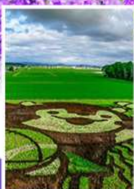
ศิลปะบนทุ่งข้าว