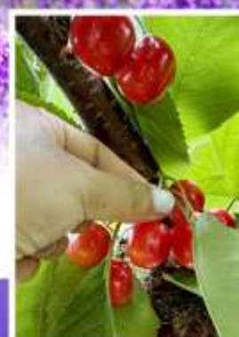
กิจกรรมเก็บเชอร์รี่

🚶 ออนเซ็น 2 ครั้ง 🧳 นน.กระบี่ 23 กก. 1 ใบ ☀️ 6Days 4Night