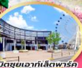
มิตซูเอากะเลียตพาร์ค เซนได

หมู่บ้านชาบูโร คาคุโนะ ดาเตะ พักออนเซ็น 1 คืน | พักเซนได 2 คืน