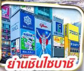
ย่านชินโซบาชิ